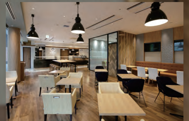
写真: Tarny Bakery Cafe (東京・大崎)

非対面・非接触スタイルが もたらす安全安心な お店づくり 総合厨房メーカーとして 多くのお客様と共に 培った経験を活かし ご提案致します