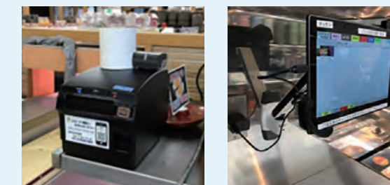
キッチンプリンタ