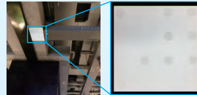
設置例 ※ラベルサイズ 150mm×150mm