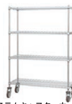
(ステムキャスターカート付)