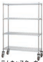
(ステムキャスターカート付)