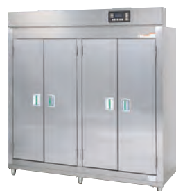
★ H202S-40BW (蒸気式)