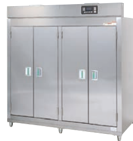
★ H202S-40BW (蒸気式)