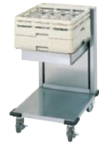
★ TOL-FR1 ¥190,000 税込¥209,000