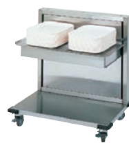
★ TOL-T2 ¥216,000 税込¥237,600