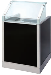
IHコンロ組み込みタイプ