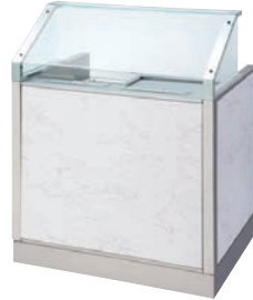
ホテルパン付き電気グリドル組み込みタイプ