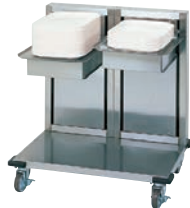
TOL-T1W ¥259,000 税込¥284,900