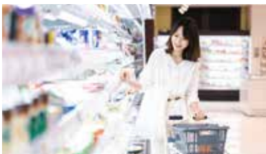
スーパーマーケット