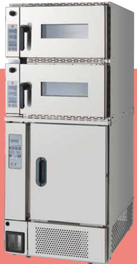
ドローンディショナー

1日あたり800~1000個の焼成能力で 従来の約1/3のスペースで設置可能なオーブンです